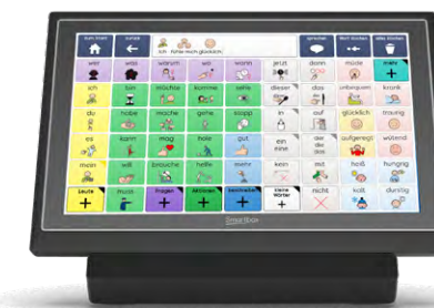
Grid Pad mit Augensteuerung

Einen basalen Zugang zur Sprache mit Grid ermöglicht das Symbolvokabular Voco Chat, während Super Core die Sprach-, Lern- und Leseentwicklung fördert. Weitere symbol- und schriftbasierte Inhalte rund um Literacy, Bildung und Teilhabe bietet AssistUK für Grid . Die Möglichkeiten der Ansteuerung sind vielfältig. Die Sprachcomputer können über Drücken auf den Bildschirm, per Taster- oder Mauseingabe sowie über eine Augensteuerung bedient werden.