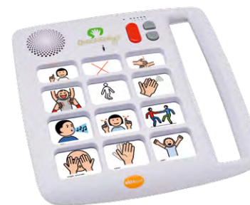
QuickTalker FT 12

Statische Kommunikationshilfen wie der QuickTalker verfügen über eine feste Anzahl von Tasten, die mit Symbolen und Aufnahmen belegt werden. Eine Person spricht Wörter oder Aussagen auf das Gerät und das Kind ruft die Mitteilung durch Drücken auf das Feld mit dem entsprechenden Symbol ab.