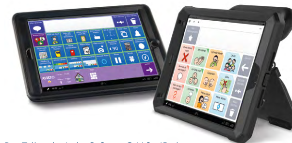
Das Talkpad mit der Software Grid for iPad umfasst viele Inhalte wie z. B. Voco Chat und AssistUK