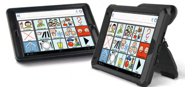
Easytalkpad mit der Software MetaTalkDE

besitzen ein berührungsempfindliches Display (Touchscreen). Dieses ermöglicht den Nutzer:innen, eigenständig zwischen den Oberflächen zu wechseln. Dabei ist eine Auswahl nach Oberbegriffen (z.B. „Gefühle“) oder nach Szenenbildern möglich. Dynamische Hilfen ermöglichen eine differenziertere Art der Kommunikation.